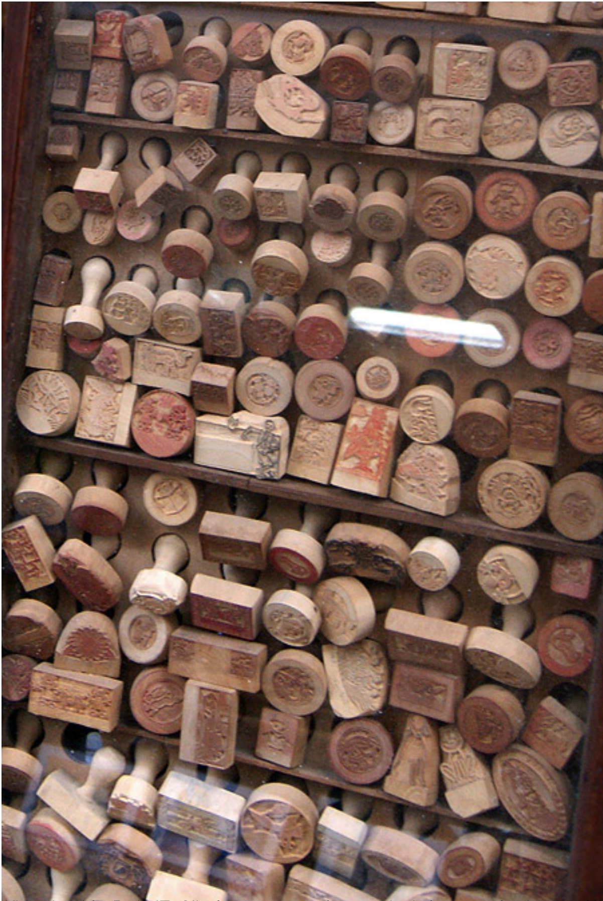
Khi đi cùng là 2B phố Thủ công cũ truyền còn tồn tại rải rác trong các phố cổ Hà Nội cũng có