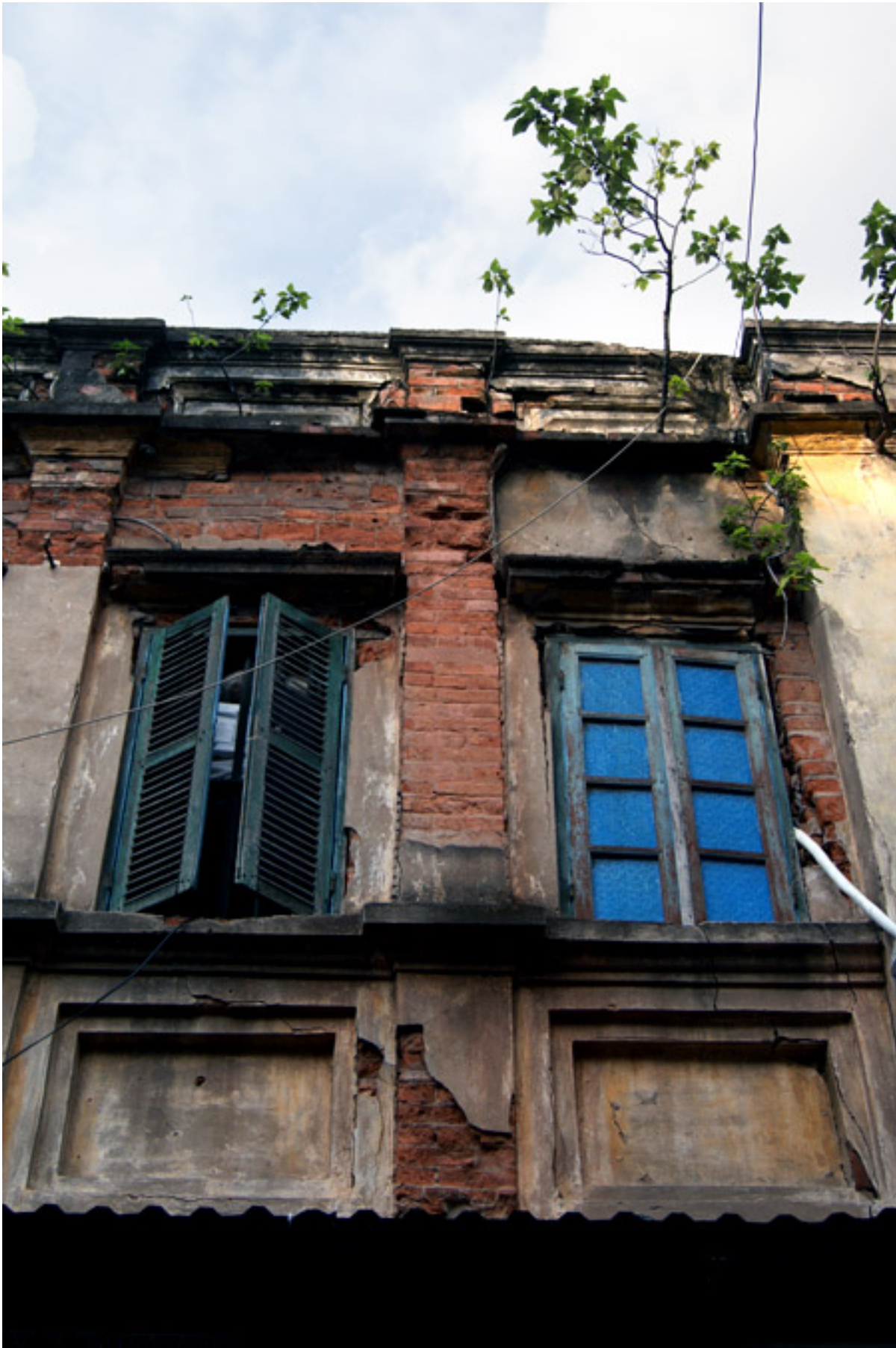
... và cửa kính trong gỗ.