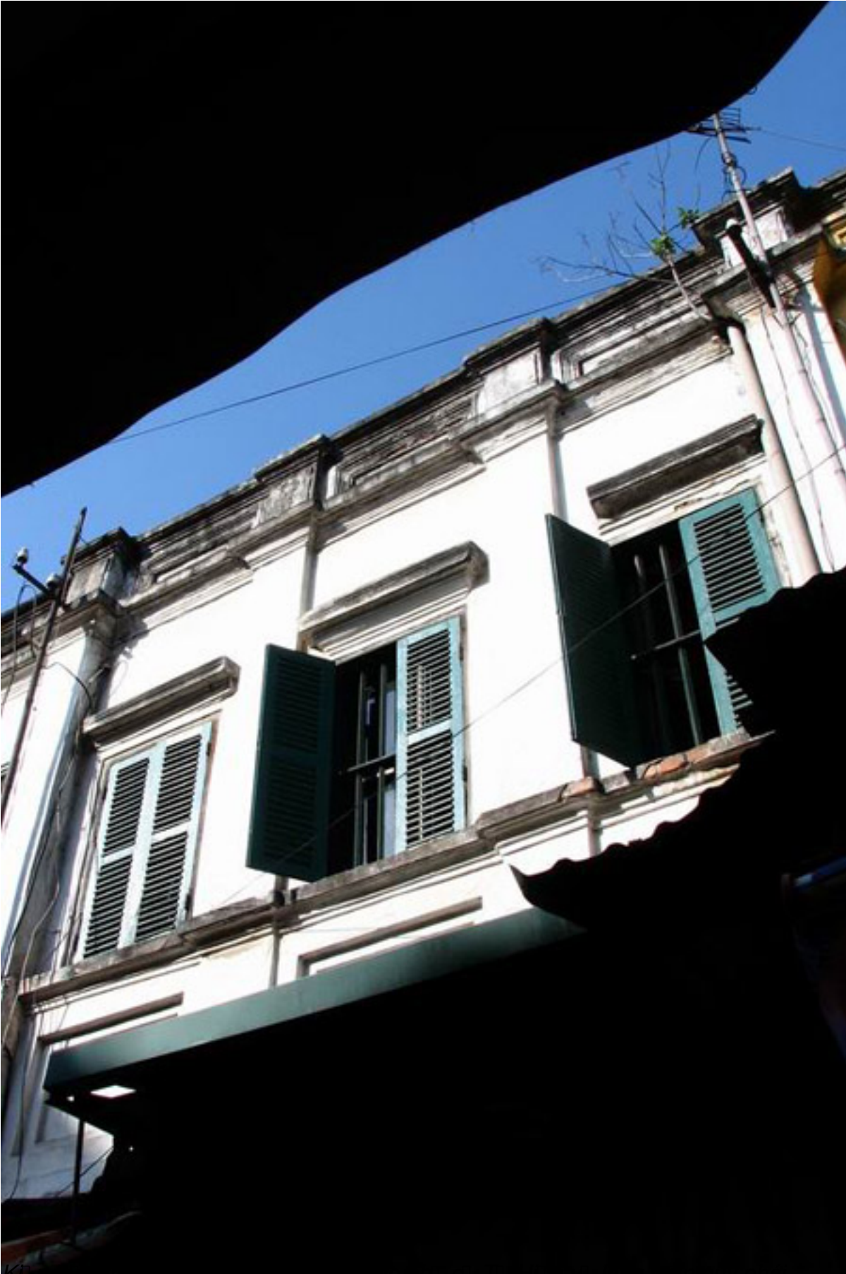
Kiến trúc này đẹp và đậm đà cho phố cổ Hội An và làng nghề quý phái...