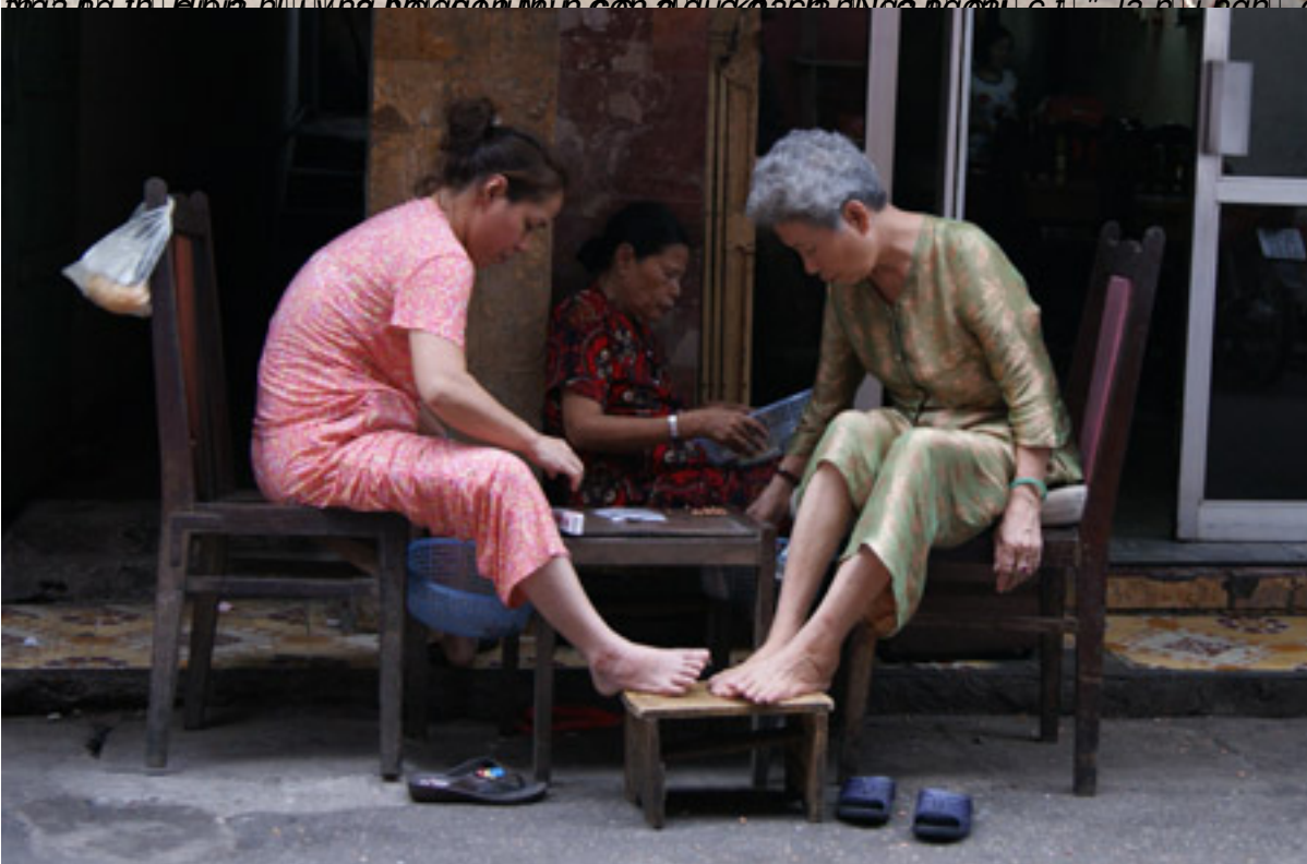
Ở những góc phố cổ Hà Nội, nhiều bà, nhiều cô vẫn thích chơi bài. Đây là nơi quen thuộc vào mỗi buổi chiều muộn.