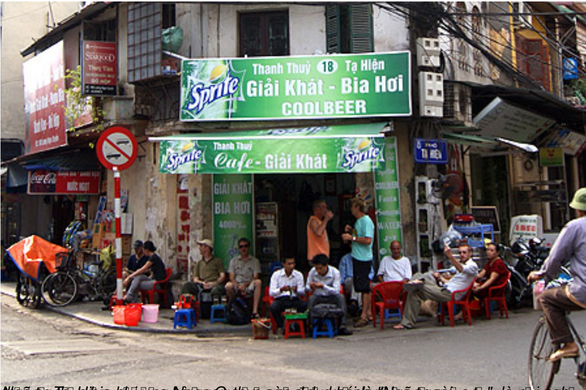
Nhà số 18 Tạ Hiện ở Hà Nội. Ở đây là nơi gặp gỡ bình thường của người dân địa phương. Đây là nơi gặp gỡ của người dân địa phương.