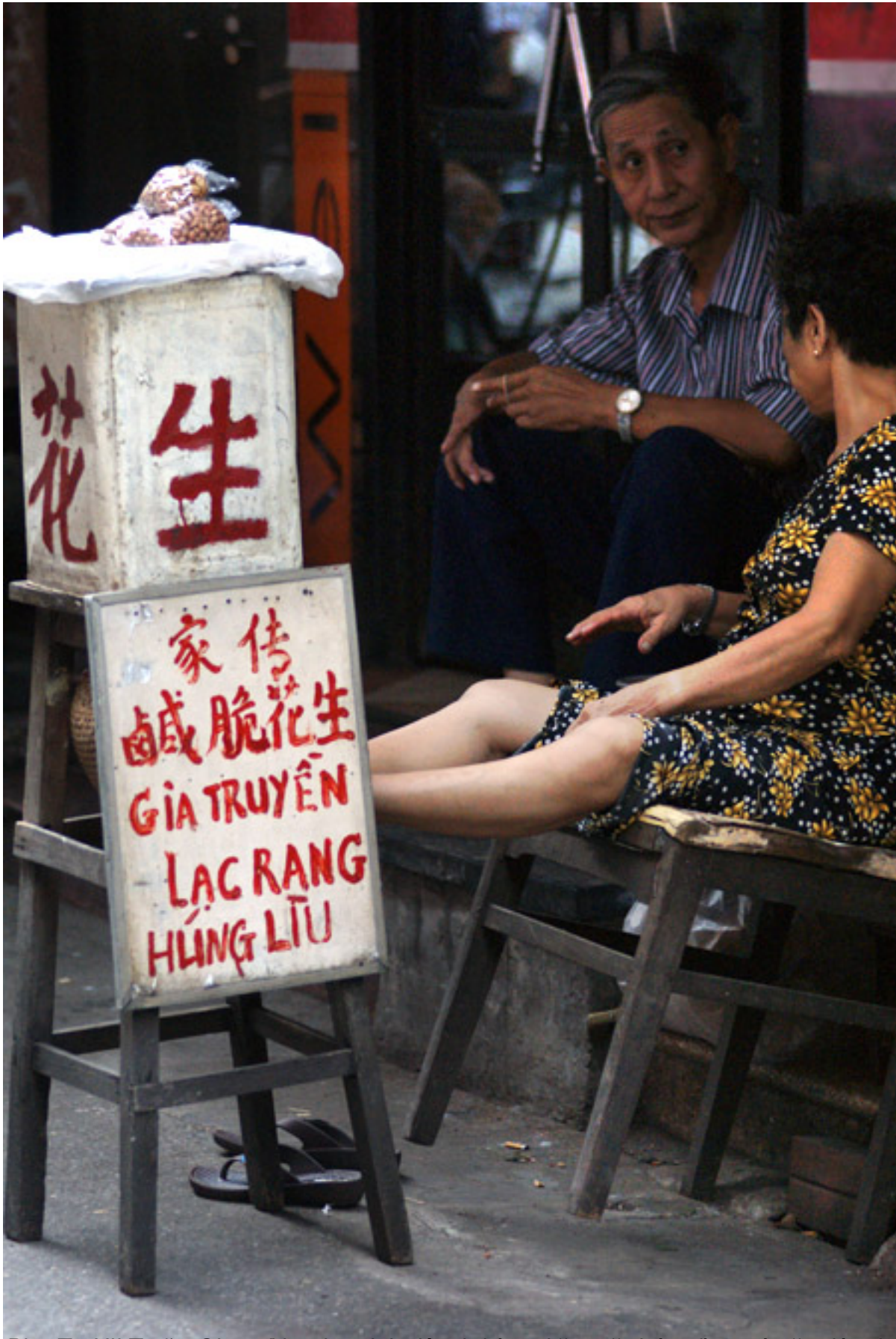
Phố cổ Hà Nội. Trưng Cầu đã mang cả nhà ở bên trong này để bán lạc rang Hùng Lữ, món ăn dân dã có vị thơm ngon.