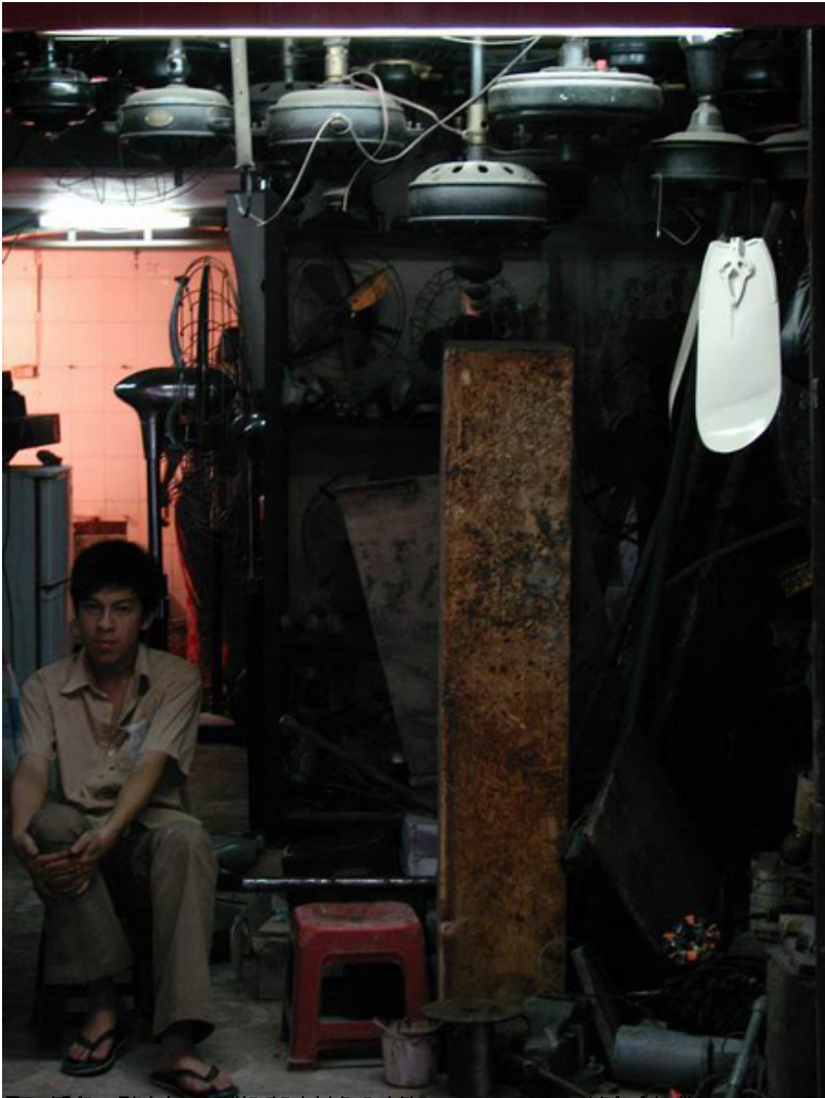
Tên Công Nghiệp là cha anh sĩ chức quân nhân công nhân vua quan ở Hà Thành