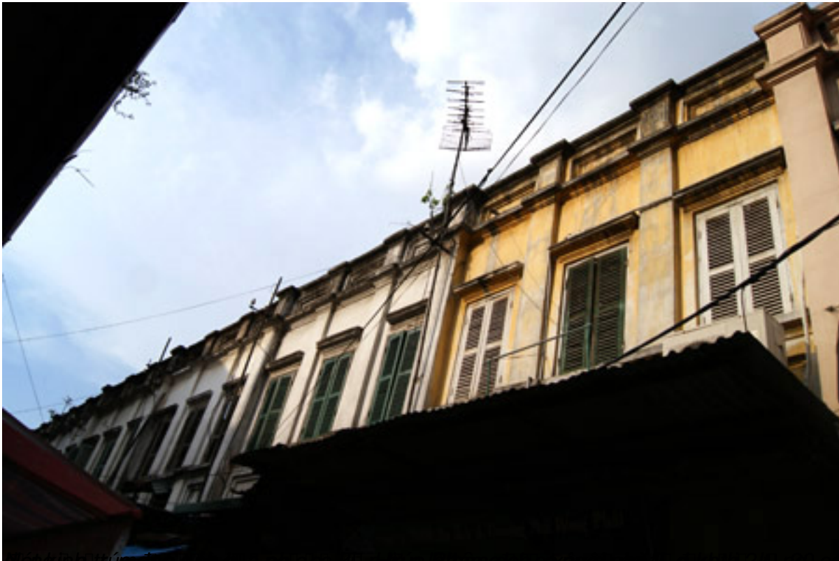
Độc đáo phố cổ Hội An