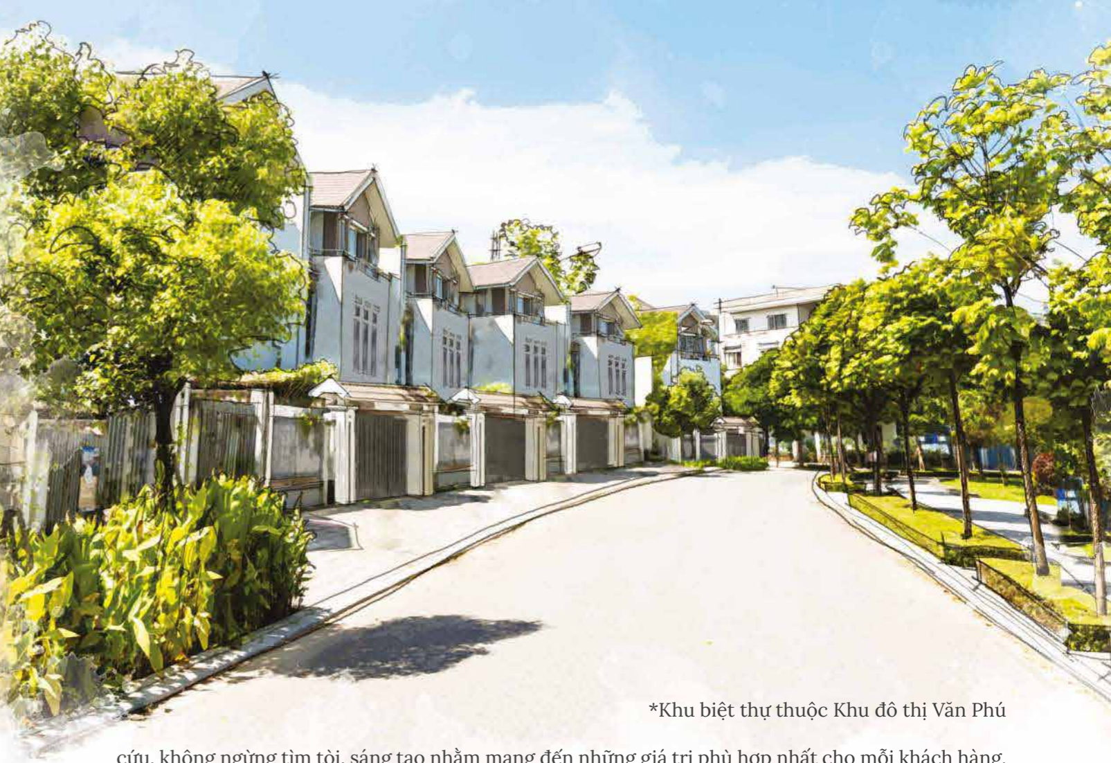
*Khu biệt thự thuộc Khu đô thị Văn Phú

Tâm thế đó luôn đồng hành cùng chúng tôi trên hành trình để tạo dựng những ngôi nhà tiện nghi, những khu đô thị khang trang, những cộng đồng hạnh phúc đủ đầy. Gần hai chục năm trôi qua, mỗi ngày, từng nhân sự của Văn Phú - Invest đều làm việc tận tâm, chuyên nghiệp để dày công nghiên