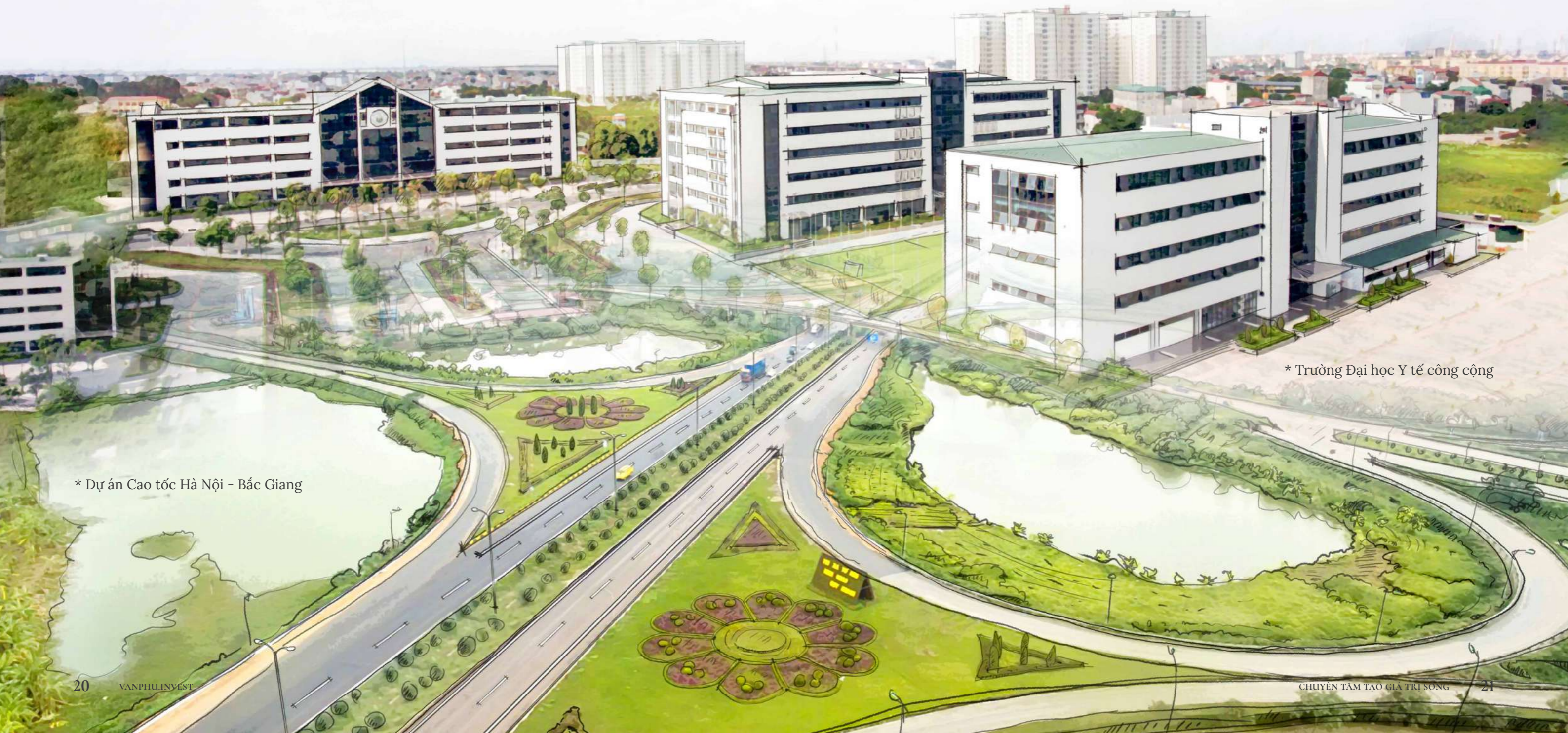
* Dự án Cao tốc Hà Nội - Bắc Giang

Cùng với đó, với tổng mức đầu tư trên 4.200 tỷ đồng, dự án BOT Hà Nội - Bắc Giang có chiều dài khoảng 45,8 km, được đầu tư xây dựng theo tiêu chuẩn đường cao tốc có vận tốc thiết kế 100 km/h. Đây là công trình có ý nghĩa quan trọng trong việc tăng cường kết nối về giao thông để thúc đẩy phát triển công nghiệp, du lịch, đô thị của Thủ đô Hà Nội.