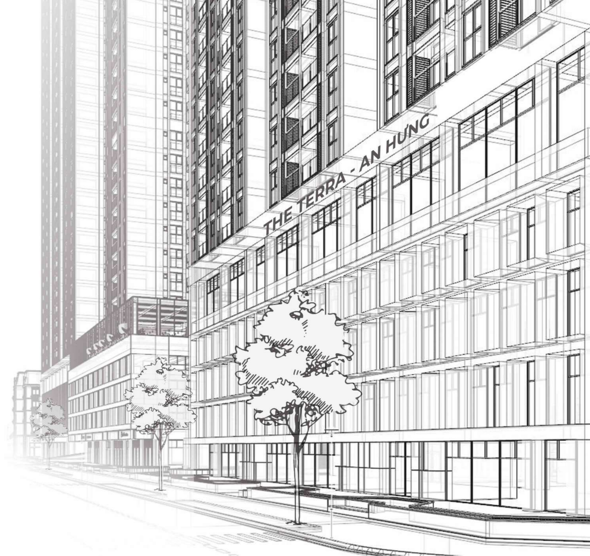
*The Terra - An Hưng