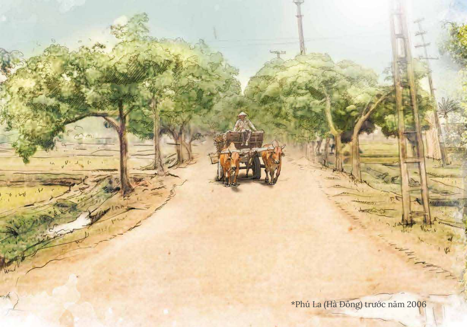
*Phú La (Hà Đông) trước năm 2006

Hơn một thập kỷ trước, vùng đất nay thuộc phường Phú La (Hà Đông) chủ yếu là cánh đồng bao quanh ngôi làng với những con ngõ nhỏ. Người dân quanh vùng khi đó chủ yếu thu nhập từ trồng lúa hoặc làm những công việc thời vụ.